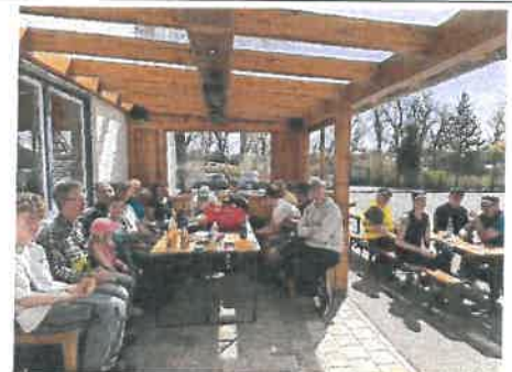
Haben sich die Brotzeit verdient: Einige der Helfer beim „Ramadama“.

Herzlichen Dank an alle freiwilligen Helfer.